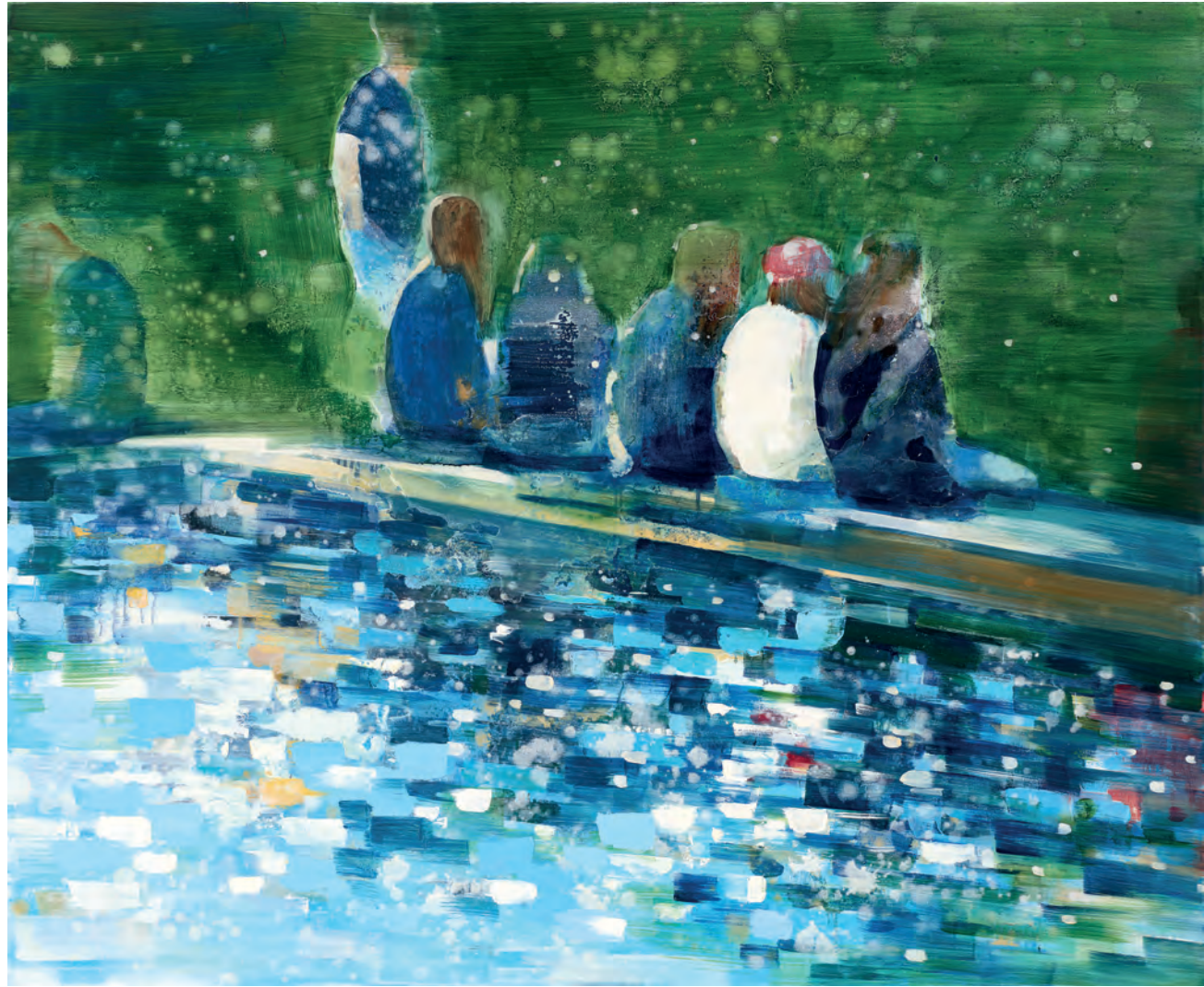
ALMOST FORGOTTEN, 2019, Öl auf Leinwand, 140 x 170 cm