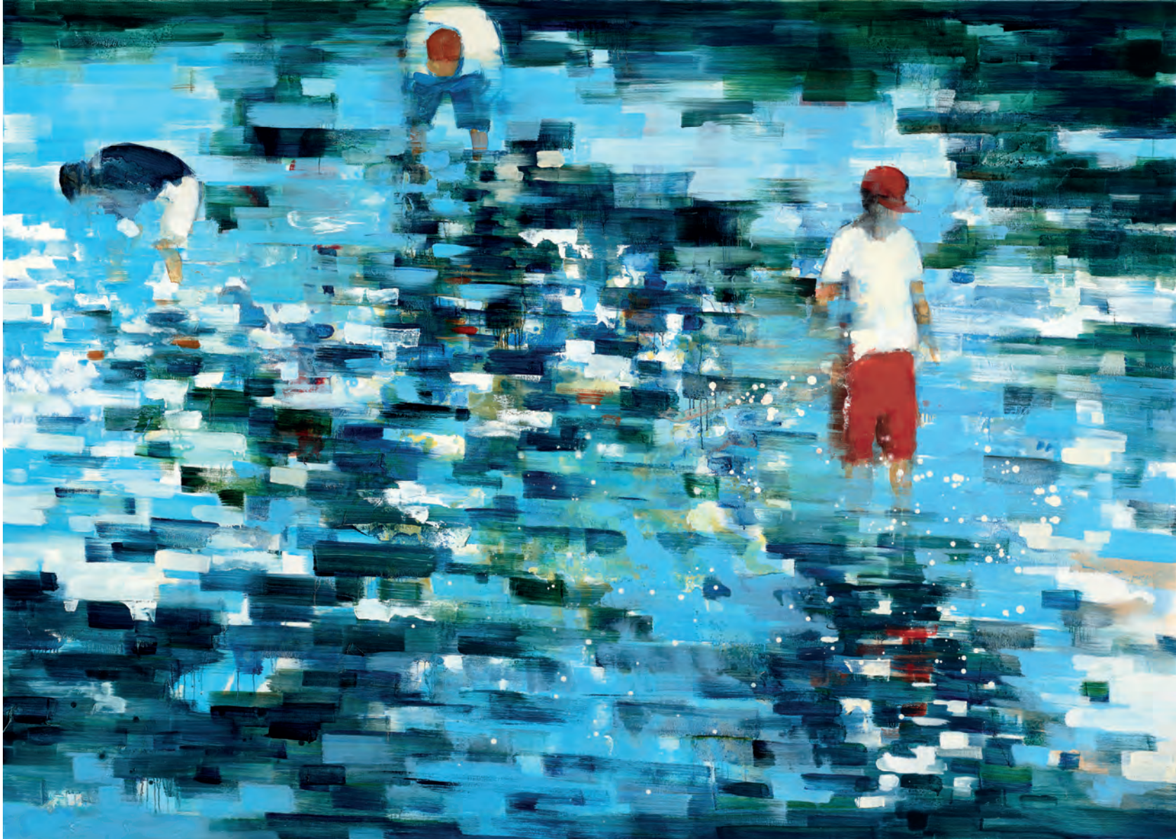
STILL SEARCHING, 2020, Öl auf Leinwand, 180 x 250 cm