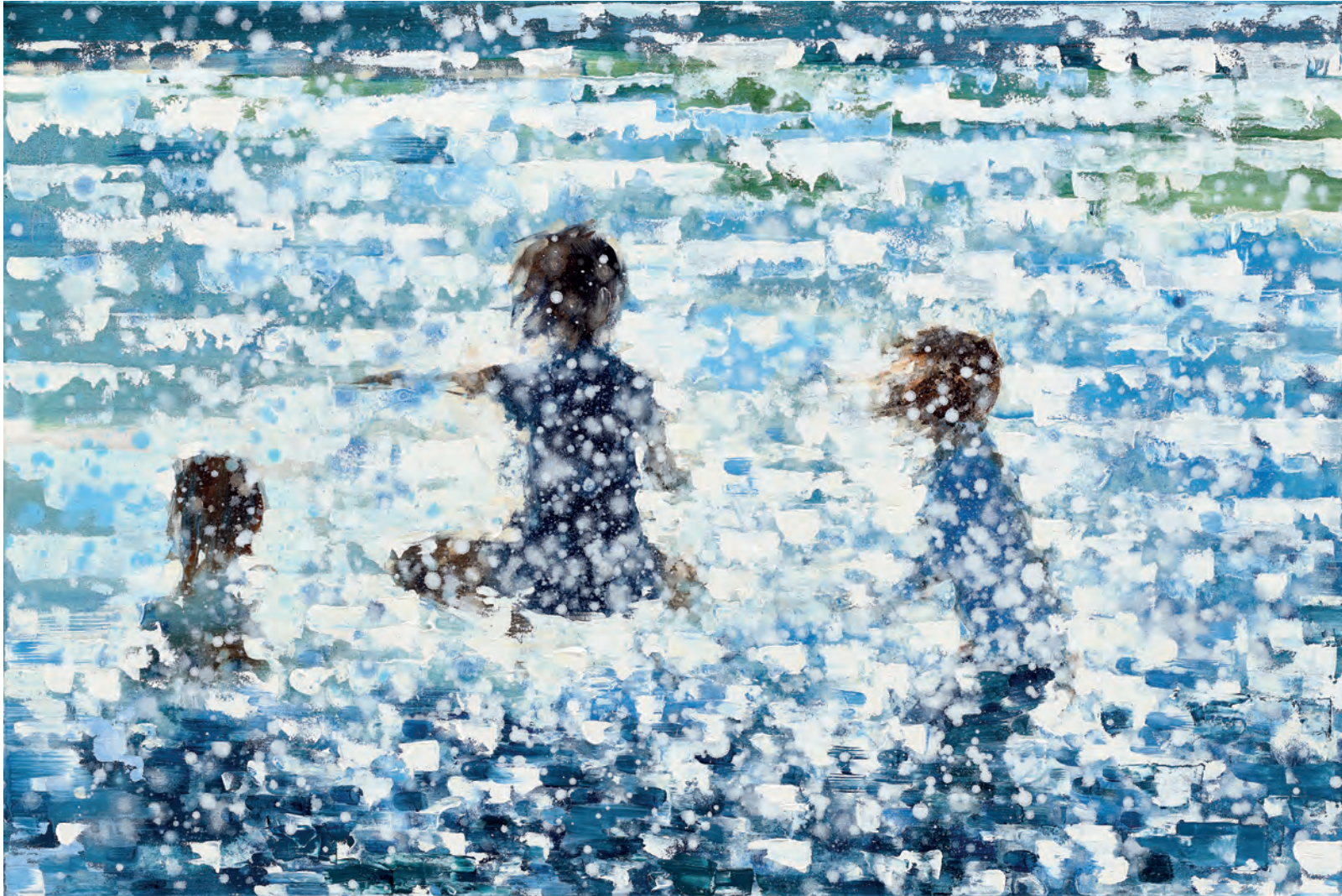
THREE KIDS, 2020, Öl auf Leinwand, 80 x 120 cm