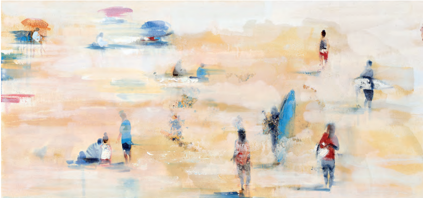
SIGNS OF THE TIMES 04, 2021, Öl auf Leinwand, 80 x 170 cm