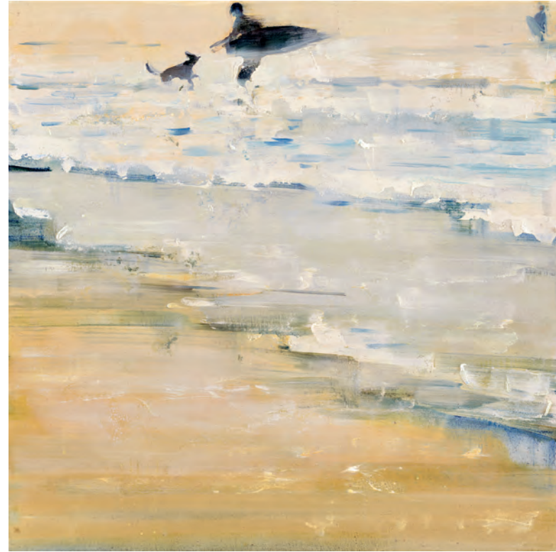
FLOWIN' 03, 2020, Öl auf Leinwand, 40 x 40 cm COME WITH ME, 2020, Öl auf Leinwand, 80 x 80 cm