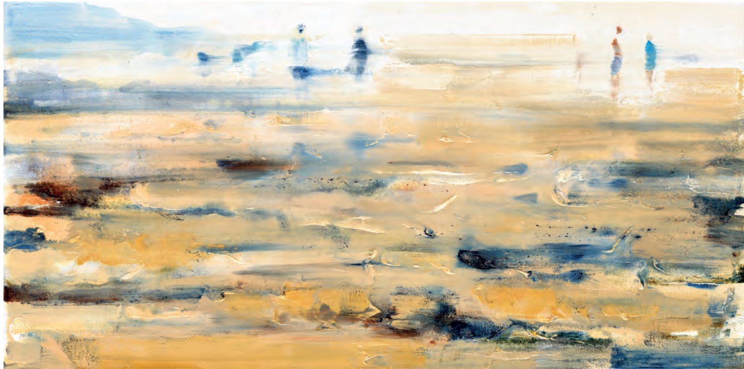
SANDSTORM, 2020, Öl auf Leinwand, 40 x 80 cm