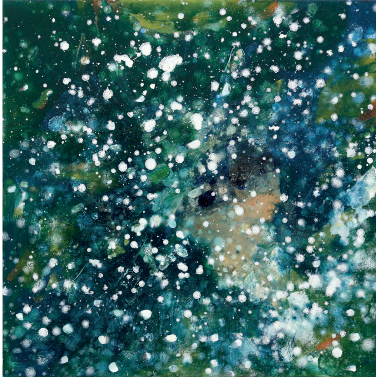
IN THE BACKGROUND, 2020, Öl auf Leinwand, 60 x 60 cm