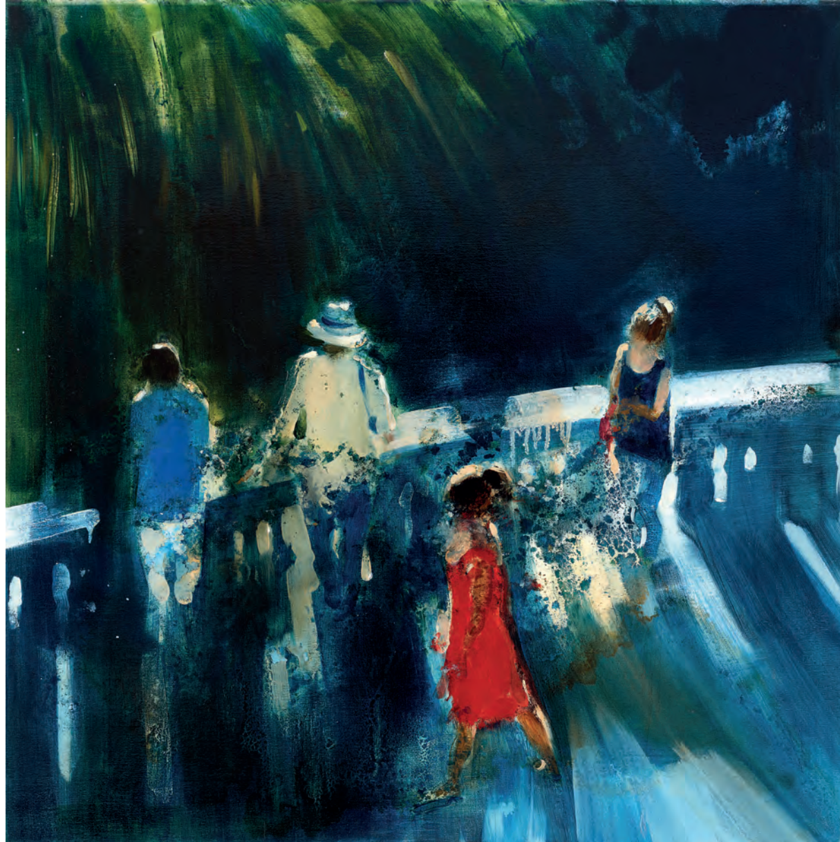
WATERFALLS 03, 2021, Öl auf Leinwand, 80 x 80 cm