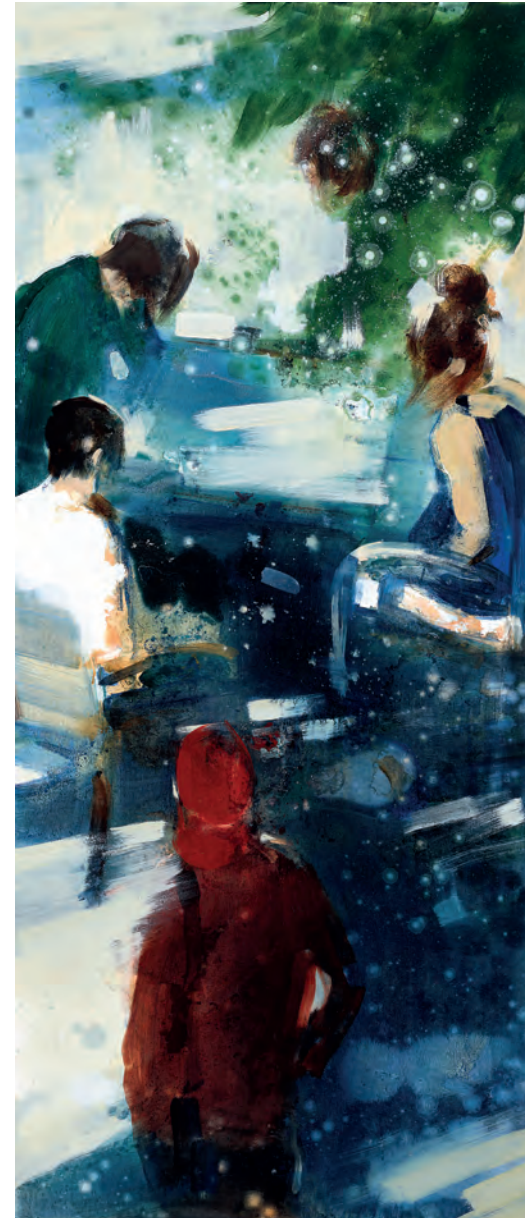
THE GAME, 2021, Öl auf Leinwand, 140 x 60 cm

Begeisterter Tumarova-Sammler und Fotograf aus BW, Deutschland.